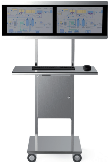
R01 mobile double screen