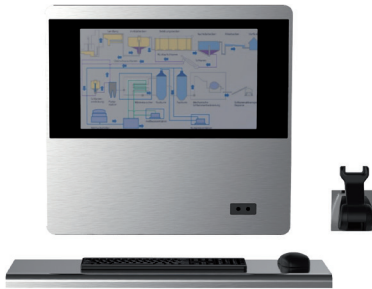
R01 recessed single screen